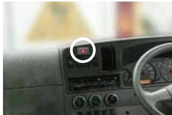
エラーインジケータ